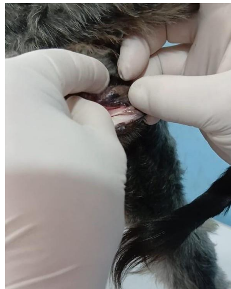
4º Dosis: 13 de diciembre