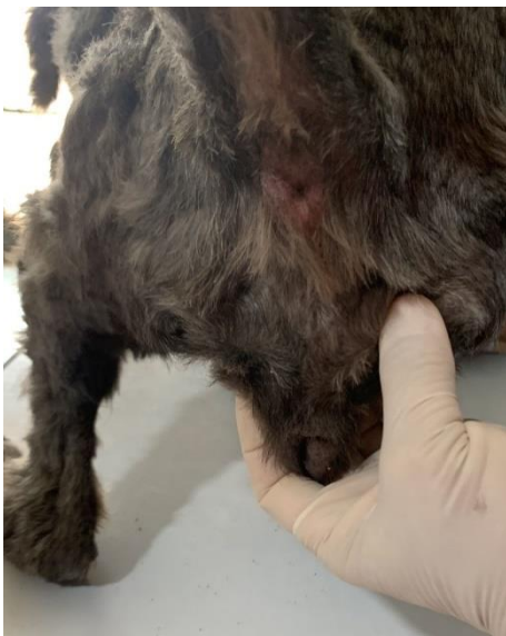
3º Dosis: 03 de diciembre