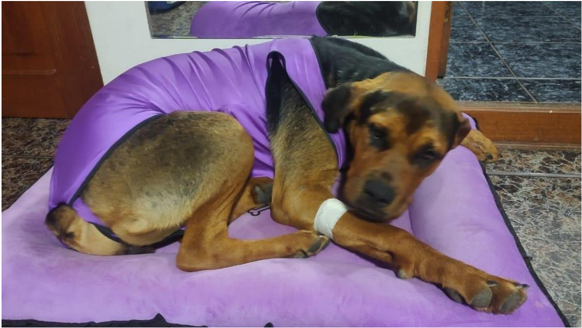
Tomasa recuperándose de la cirugía.