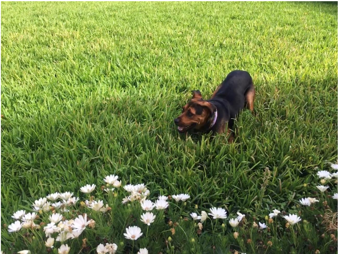
Tomasa en su hogar adoptivo.