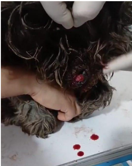
1º Dosis: 12 de noviembre