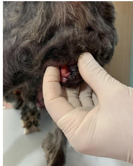
2º Dosis: 22 de noviembre